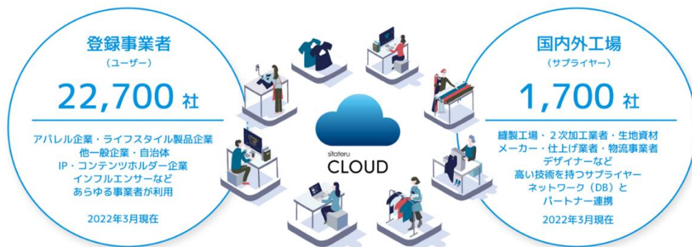
sitateru CLOUD のイメージ

「クラウドサービス」である衣服生産プラットフォーム『sitateru CLOUD』は、ものづくりの効率化・DXを推進する「生産支援機能」と、あらゆる事業者のアイテム販売・DtoC（ダイレクト・トゥー・コンシューマー）事業をサポートする「販売支援機能」を兼ね揃えた、クラウドサービスです。